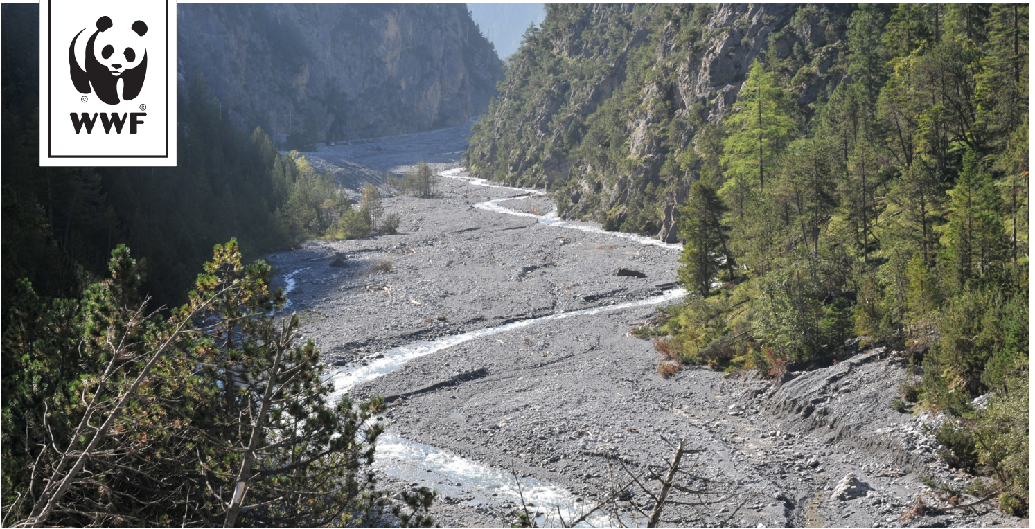
Clemgia © Mathis Müller