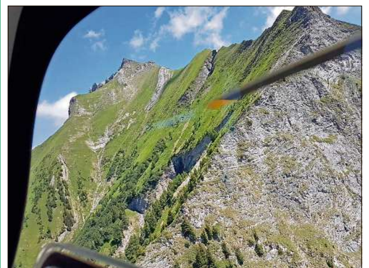
La Rega ha sgulà la bara da l'um al Falknis.

In um da 59 onns è crudà giu en la vischinanza dal Mazorakopf al Falknis sper Maiavilla. El è sa blessà mortalmain. L'accident è capità dumengia a bun'ura, sco quai che la polizia chantunala communitescha. L'um haja perdi l'equiliber en la vischinanza dal Mazorakopf sin bun 2300 meters sur mar e saja crudà d'ina taissa spunda giuadora. Tar la crudada è l'alpinist sa blessà mortalmain. Per sclerir il decurs exact da l'accident tschertga la polizia perdirtgas. En spezial supplitgescha ella l'um che ha discurre cun la Rega da s'annunziar. El sco era ses dus accumuladers hajan observà l'accident.