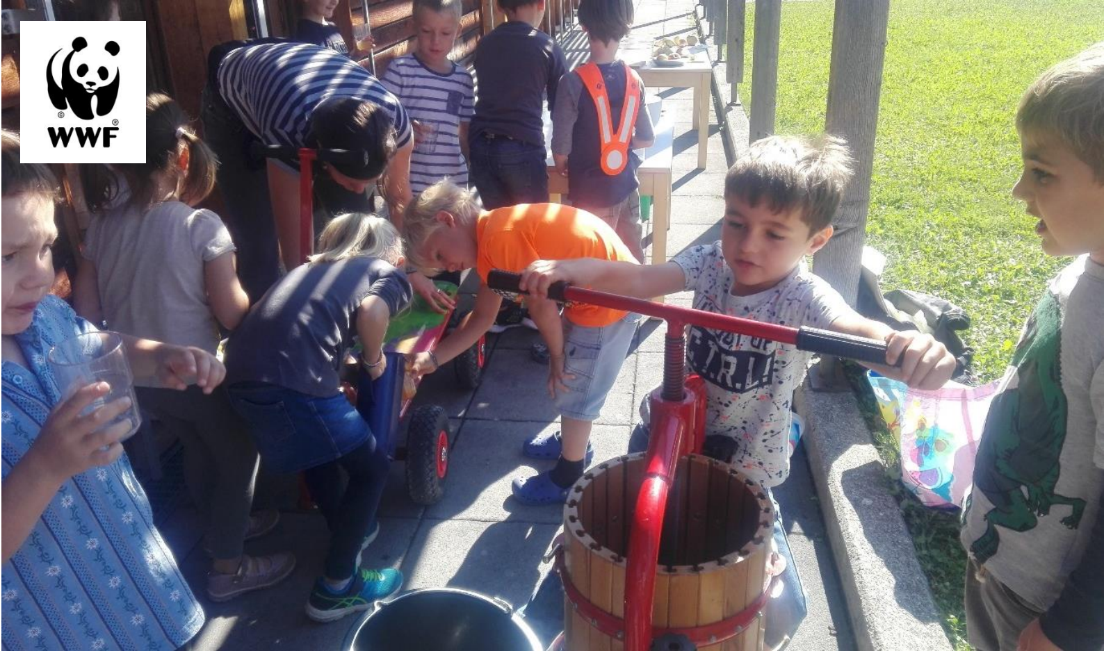
Kinder beim Mosten in Jenins